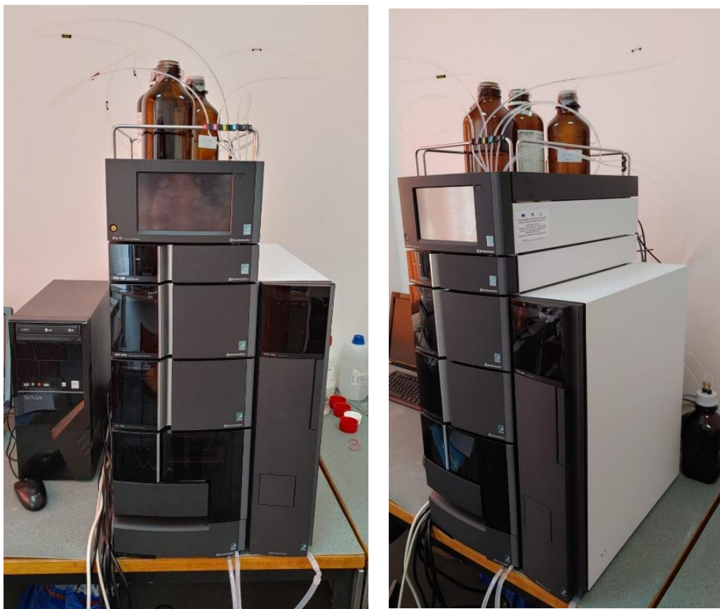
Figura 1. Cromatograf de lichide de înaltă performanță (HPLC)