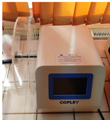
Figura 8. Tester de friabilitate