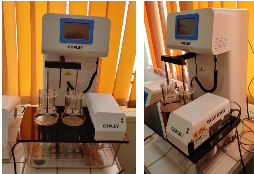
Figura 7. Tester de dezintegrare