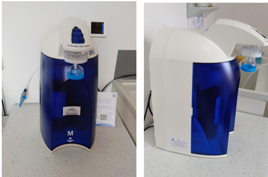
Figura 10. Sistem producere apă ultrapură