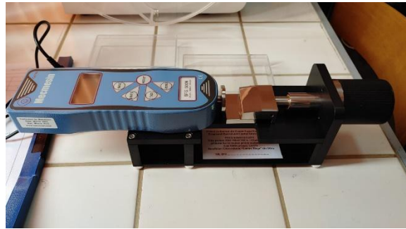
Figura 9. Tester de duritate