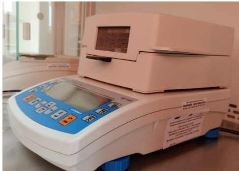
Figura 6. Termobalanță