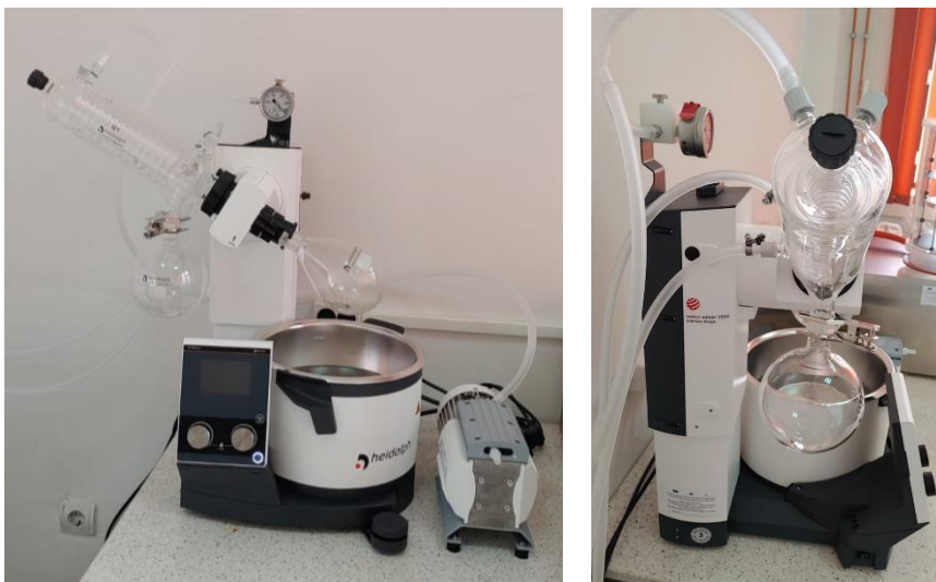
Figura 3. Rotavapor