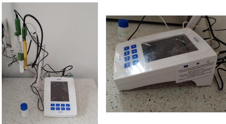
Figura 2. Multimetricu de laborator